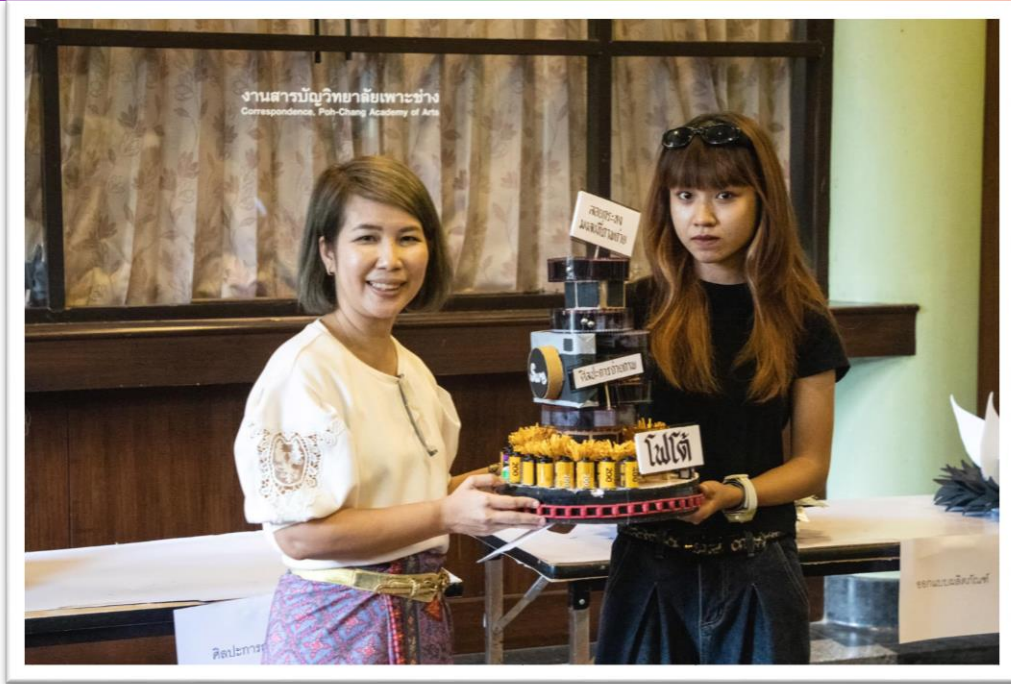
ภาพ กิจกรรม “วันลอยกระทง”