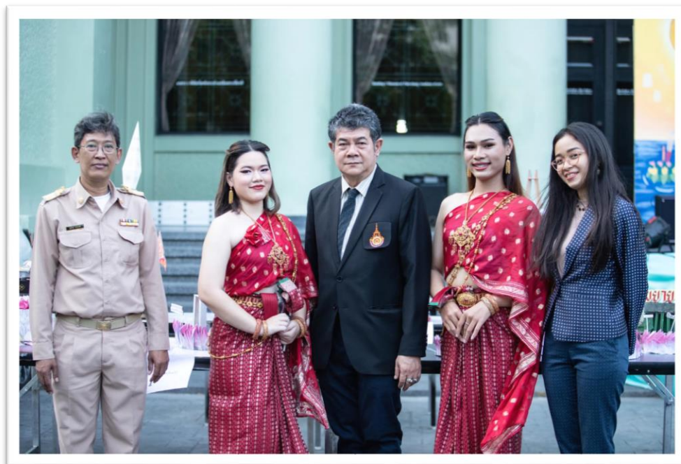
ภาพ พิธีเปิดกิจกรรม “วันลอยกระทง”