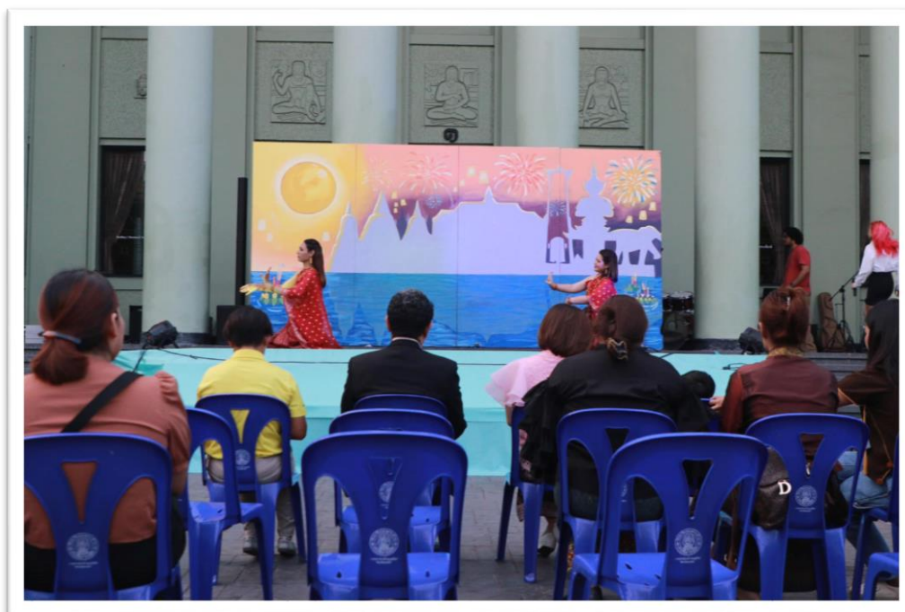
ภาพ การแสดงของนักศึกษาจากกิจกรรม “วันลอยกระทง”