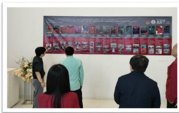
ภาพ ผู้เข้าร่วมนิทรรศการ ศิลปกรรมรำลึก (อดีต-ปัจจุบัน) International ART Festival & Workshop in Thailand