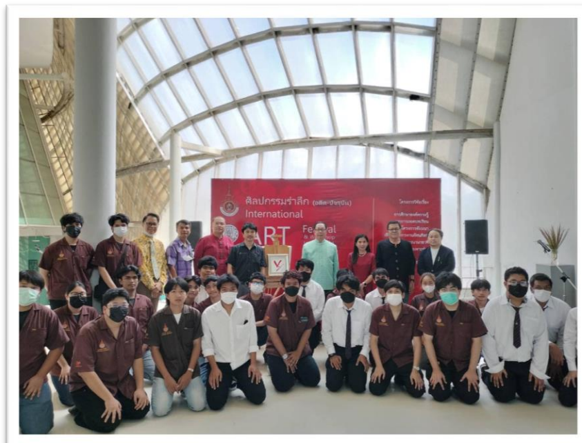
ภาพ เปิดงานนิทรรศการ ศิลปกรรมรำลึก (อดีต-ปัจจุบัน) International ART Festival & Workshop in Thailand