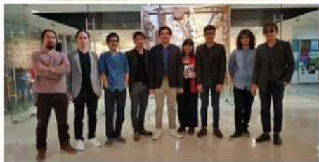
ไทยจ๋า 1 2562