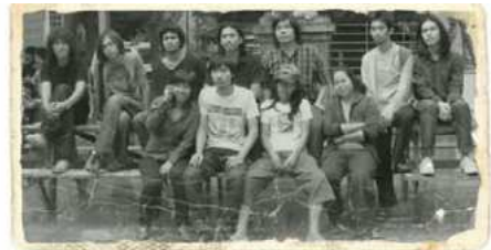
ศิลปนิพนธ์ 2550