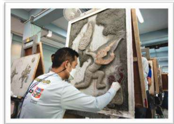
ปฏิบัติการศิลปะปูนปั้น โดยประติมากรยอดเยี่ยม ของโครงการประกวดศิลปะปูนปั้นแห่งประเทศไทย