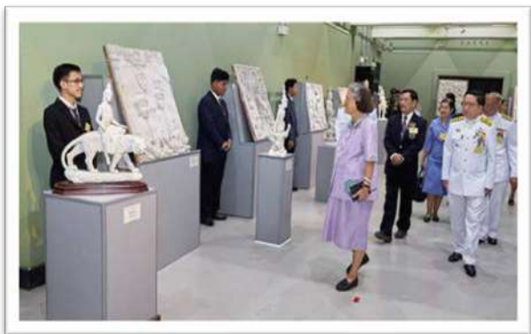
สมเด็จพระเทพรัตนราชสุดาฯ สยามบรมราชกุมารี ทอดพระเนตรนิทรรศการลวดลายศิลปะปูนปั้น