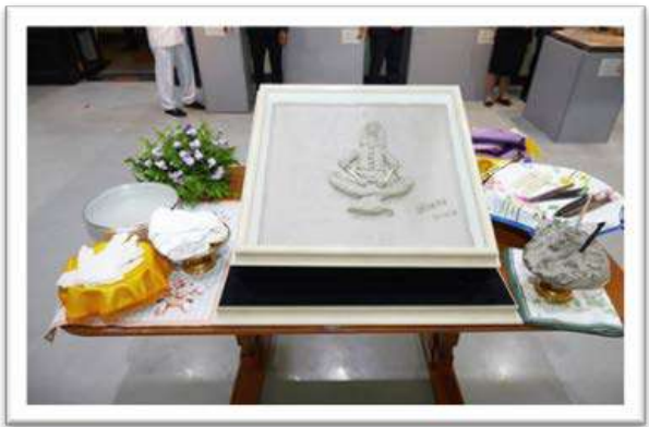
ทรงวาดลวดลายบนแผ่นปูนปั้นด้วยเครื่องมือปั้น ศิลปะปูนปั้นไทยได้สืบทอดกันมาแต่ครั้งอดีตจนถึงปัจจุบัน