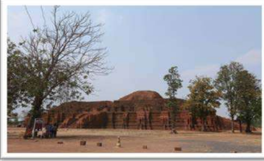
การสัมมนาทางวิชาการและทัศนศึกษา การประกวดศิลปะปูนปั้นแห่งประเทศไทย ณ อุทยานประวัติศาสตร์ศรีเทพ เพชรบูรณ์