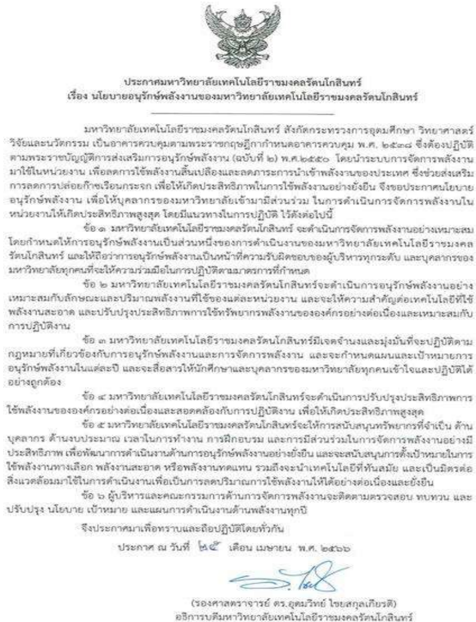
รูป 1.1 แสดงเอกสารประกาศนโยบายด้านอนุรักษ์พลังงาน

ผู้บริหารของมหาวิทยาลัยเทคโนโลยีราชมงคลรัตนโกสินทร์ ได้ดำเนินการจัดทำนโยบายอนุรักษ์พลังงานของหน่วยงาน และประกาศใช้นโยบายดังกล่าว เพื่อแสดงถึงความมุ่งมั่นที่จะดำเนินกิจกรรมการอนุรักษ์พลังงาน ดังแสดงในรูป