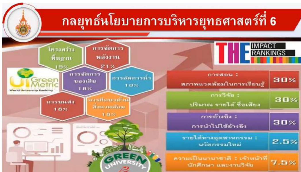
รูปที่ 1.2 บอร์ดประชาสัมพันธ์เรื่องของการอนุรักษ์พลังงาน

ทางมหาวิทยาลัยได้มีการประชาสัมพันธ์เรื่องของการอนุรักษ์พลังงาน โดยได้จัดทำบอร์ดเรื่องของการอนุรักษ์พลังงาน ข้อมูล ข่าวสาร กิจกรรม นโยบายด้านพลังงาน ประกาศแต่งตั้งคณะกรรมการด้านอนุรักษ์พลังงาน เพื่อให้พนักงานได้รับทราบถึงกิจกรรมที่ทางมหาวิทยาลัยได้เข้าร่วมโครงการอย่างทั่วถึง