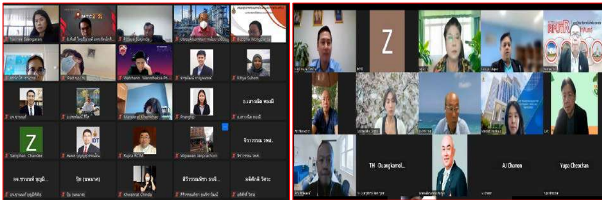
รูปที่ 1.3 การดำเนินการหาแนวทางการอนุรักษ์พลังงาน

การอบรมเริ่มต้นโดยทีมงานของมหาวิทยาลัย ได้กล่าวถึงนโยบายของมหาวิทยาลัยในเรื่องการอนุรักษ์พลังงาน ให้แก่พนักงานได้ทราบถึงความมุ่งมั่นของฝ่ายบริหาร นอกจากนี้ได้มีการบรรยายเนื้อหาจิตสำนึกการอนุรักษ์พลังงาน ความเข้าใจและหลักการการอนุรักษ์พลังงาน และการมีส่วนร่วมของพนักงานในการอนุรักษ์พลังงาน