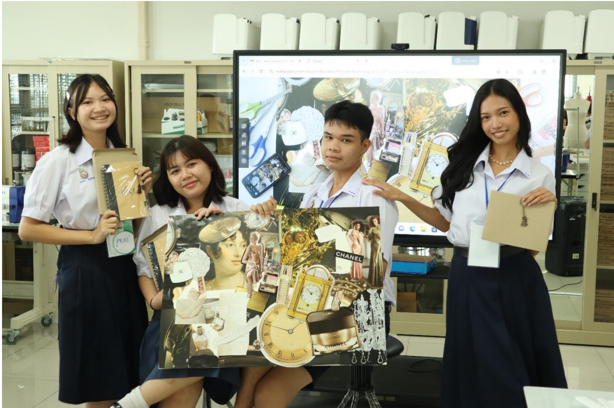
รายงาน โดย ดร. ปิยะรัตน์ จันทรมุข รองผู้อำนวยการฝ่ายบริหาร วิทยาลัยผู้ประกอบการสร้างสรรค์นานาชาติรัตนโกสินทร์