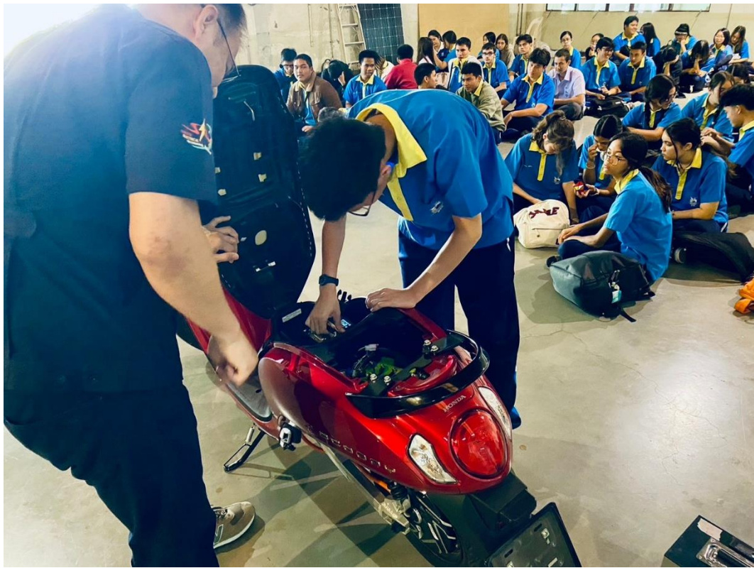
เรียนรู้การบำรุงรักษาแบตเตอรี่จักรยานยนต์ไฟฟ้า