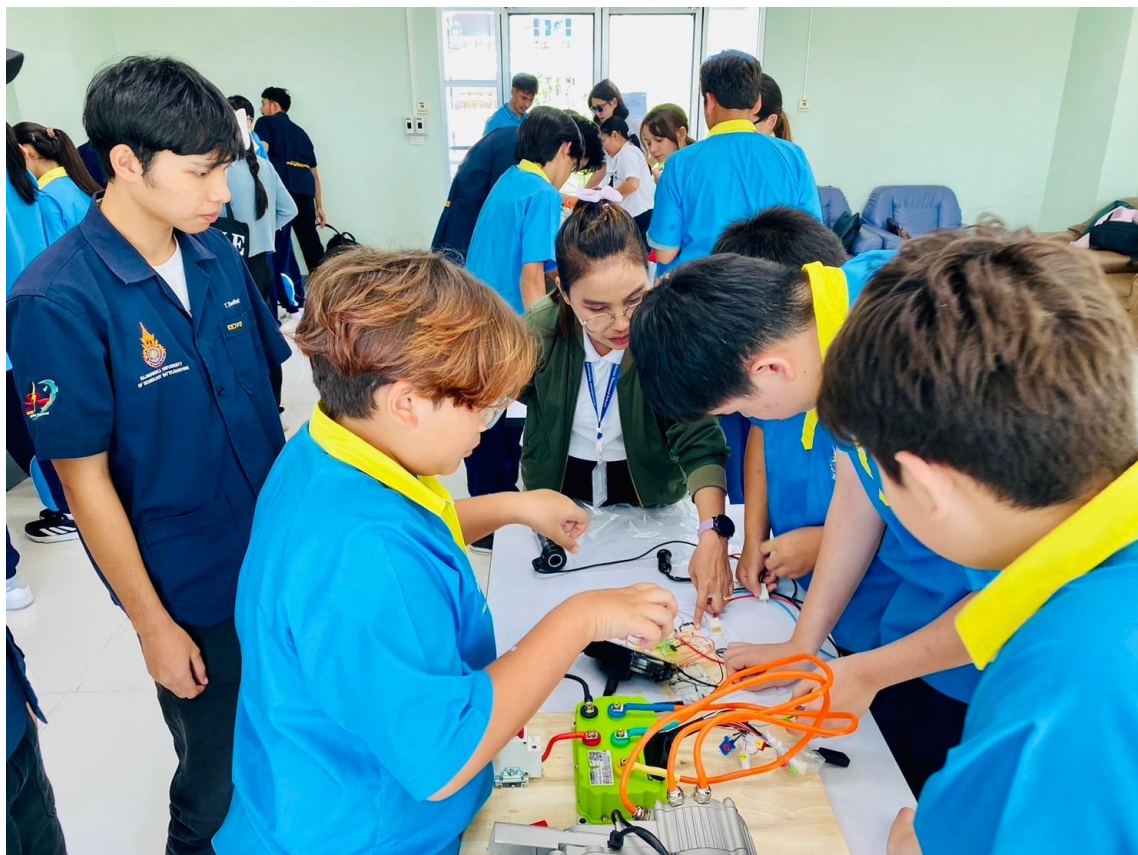
ฝึกอบรมภาคปฏิบัติ การประกอบวงจรระบบขับเคลื่อนจักรยานยนต์ไฟฟ้า