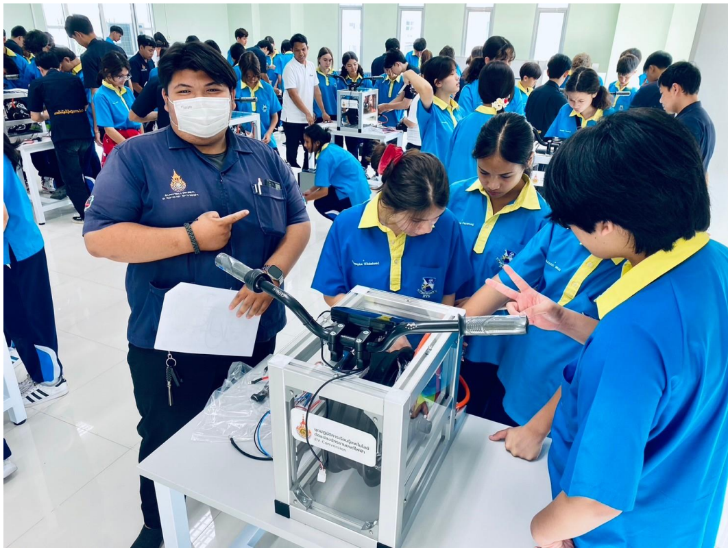
ฝึกอบรมภาคปฏิบัติ การประกอบวงจรระบบขับเคลื่อนจักรยานยนต์ไฟฟ้า