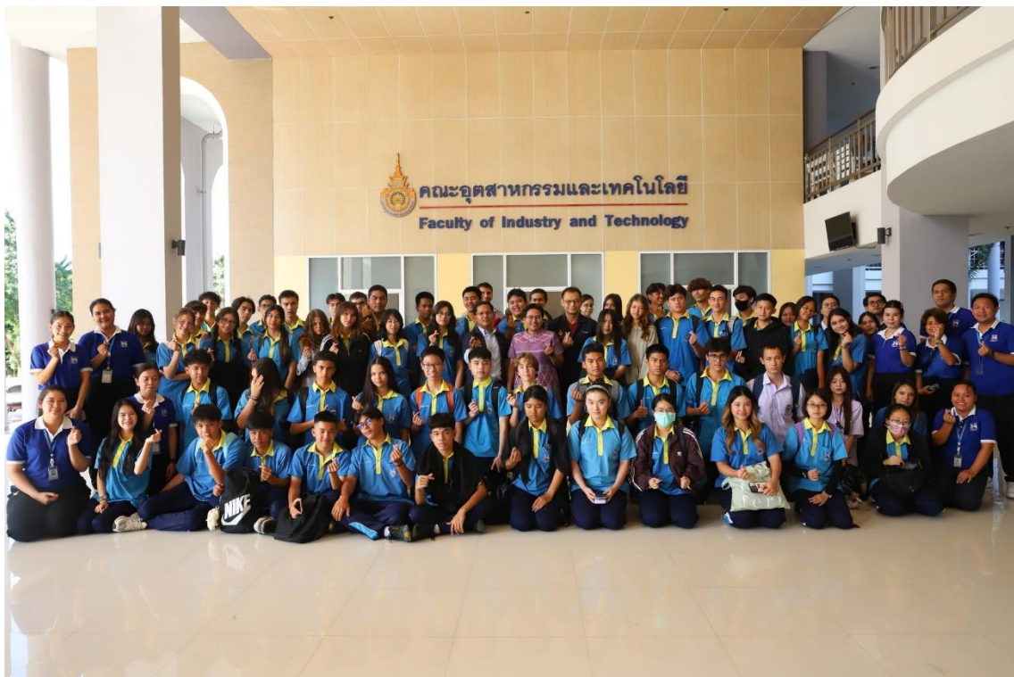
ถ่ายภาพรวมปิดโครงการ