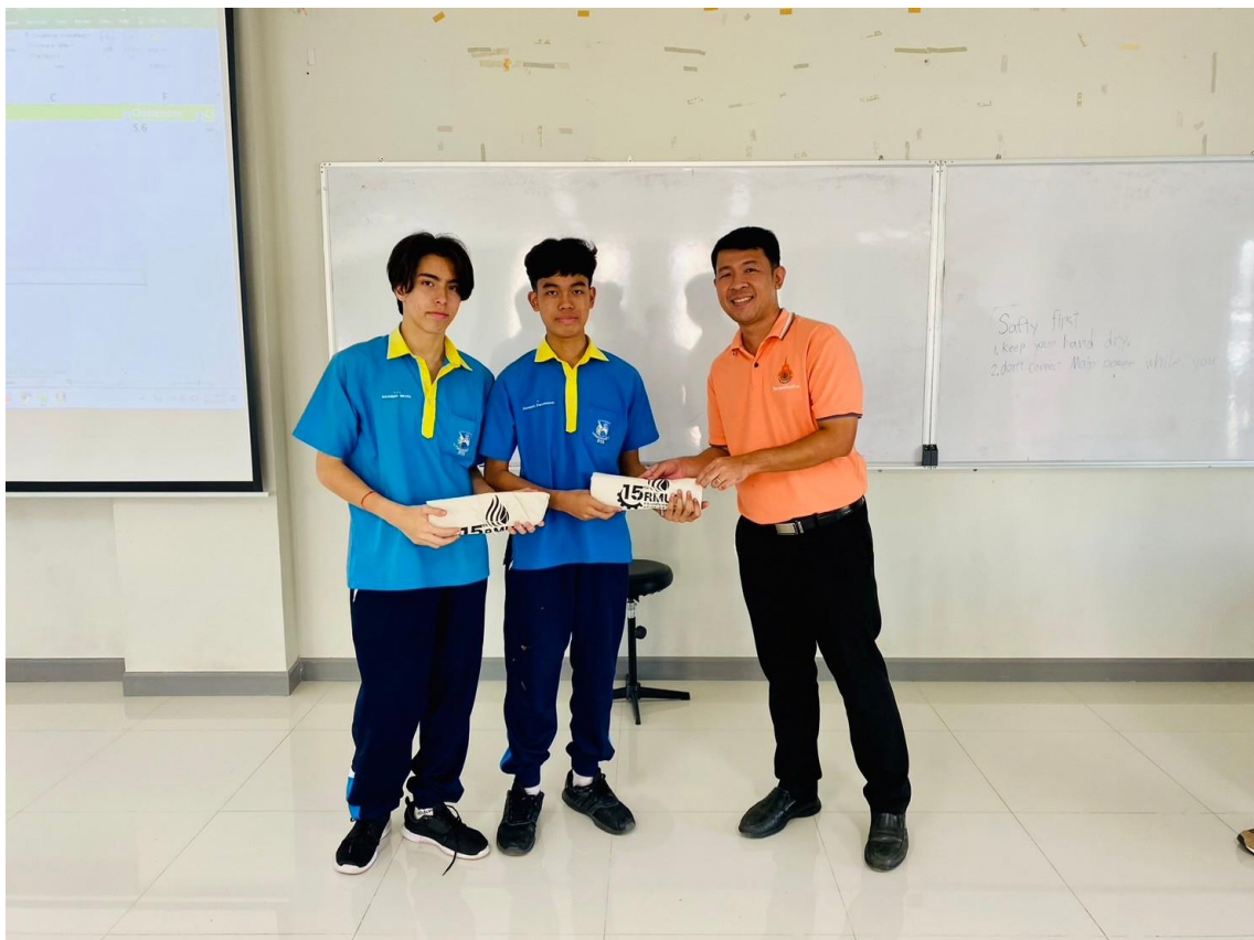
มอบของรางวัลสำหรับนักเรียนที่ได้คะแนนดีในภาคฝึกปฏิบัติ