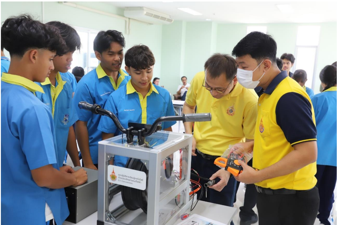
ฝึกอบรมภาคปฏิบัติ การประกอบวงจรระบบขับเคลื่อนจักรยานยนต์ไฟฟ้า