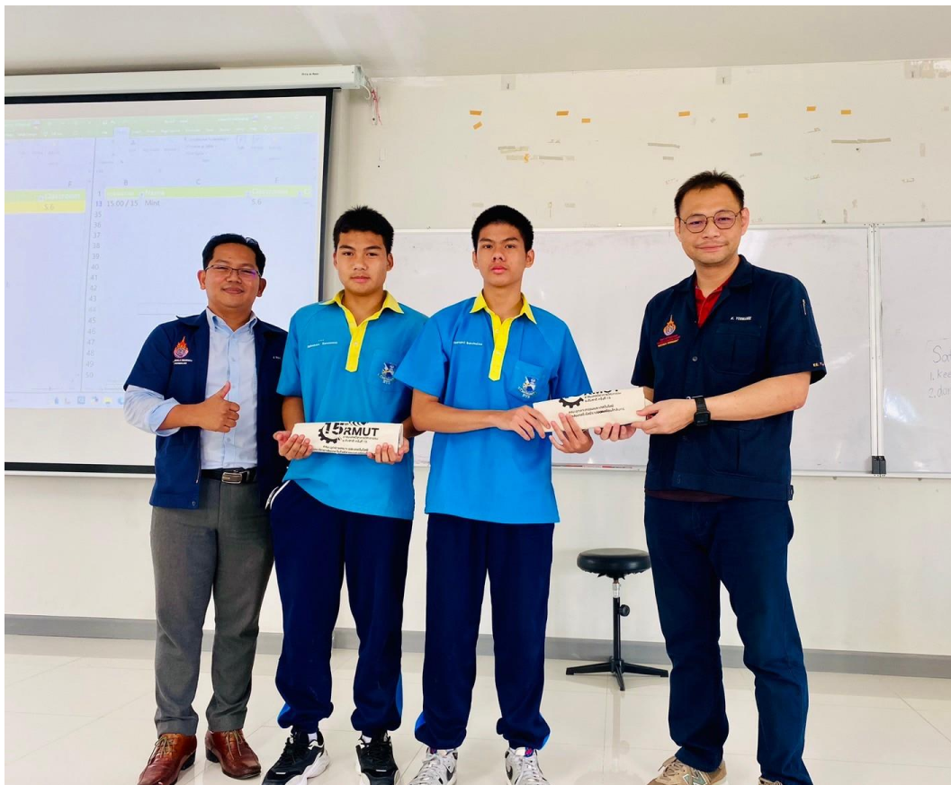
มอบของรางวัลสำหรับนักเรียนที่ทำได้คะแนนดีในภาคฝึกปฏิบัติ