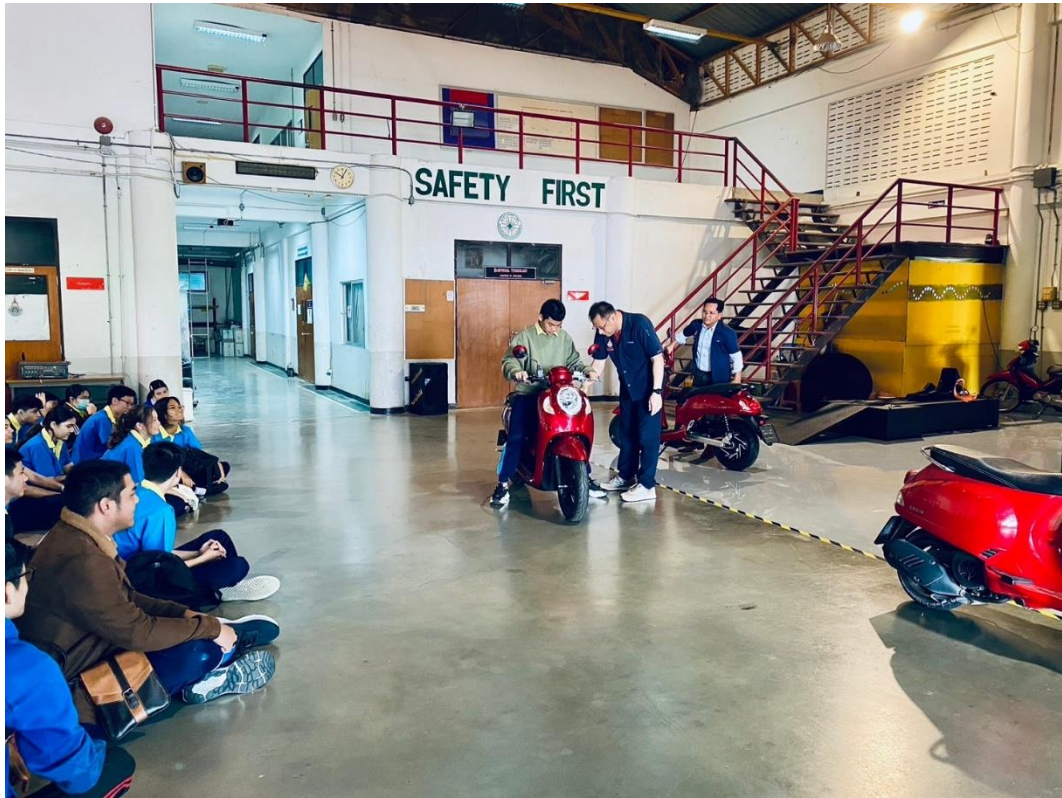
พาชมศูนย์ซ่อมบำรุงจักรยานยนต์ไฟฟ้า และทดลองขับ