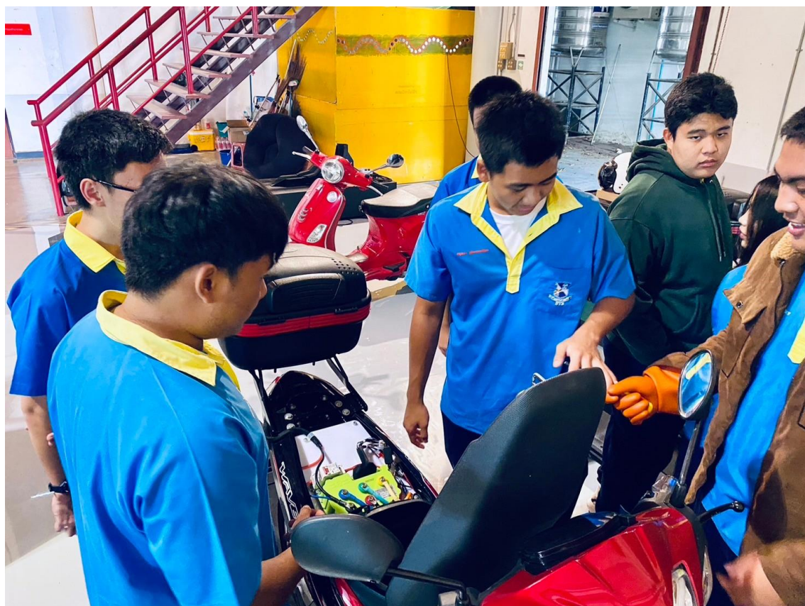
ลงมือปฏิบัติซ่อมบำรุงจักรยานยนต์ไฟฟ้า