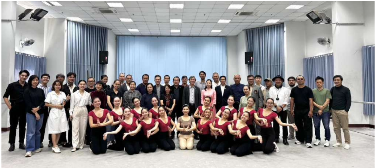
การศึกษาดูงานการเรียนการสอน