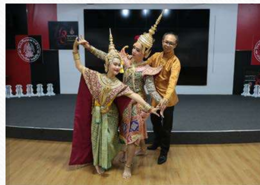
จากงานนาฏกรรม รามเกียรติ์ สู่งานประติมากรรมไทย