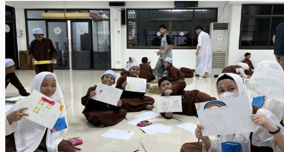
บ้านหนังสือ แผลง(ชุมชน) ในเมือง