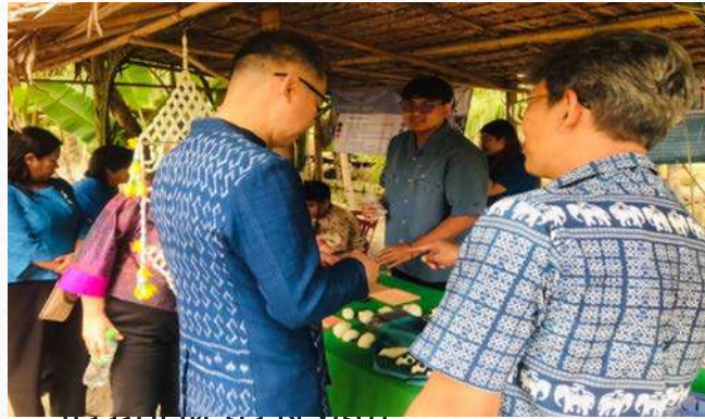
ชมผลงานที่เสร็จแล้ว