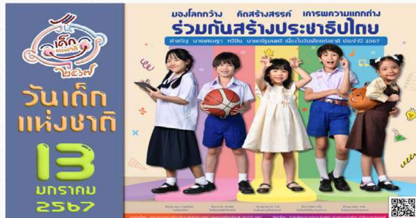
เรียนดี มีความสุข